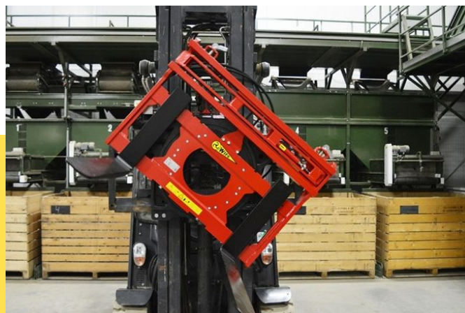
WIFO Rotator KRM360